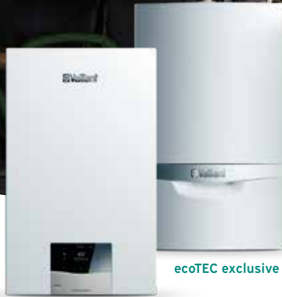
ecoTEC plus 8-5 ecoTEC plus 1-5